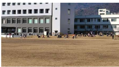
多くの保護者の方々