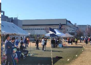
OB等はこちらサイドに