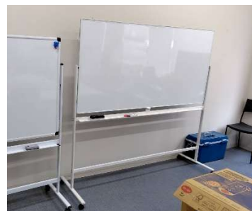
平常時はホワイトボードとして