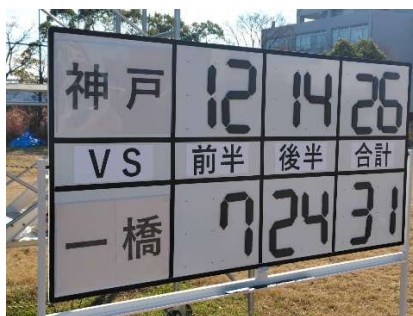
新調したスコアボード