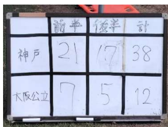
作成前のスコアボード

最終的に、基金で購入したホワイトボードは56,500円とやや高めになりましたが、OB会計が負担したパーツ代は1,870円に収まりました。